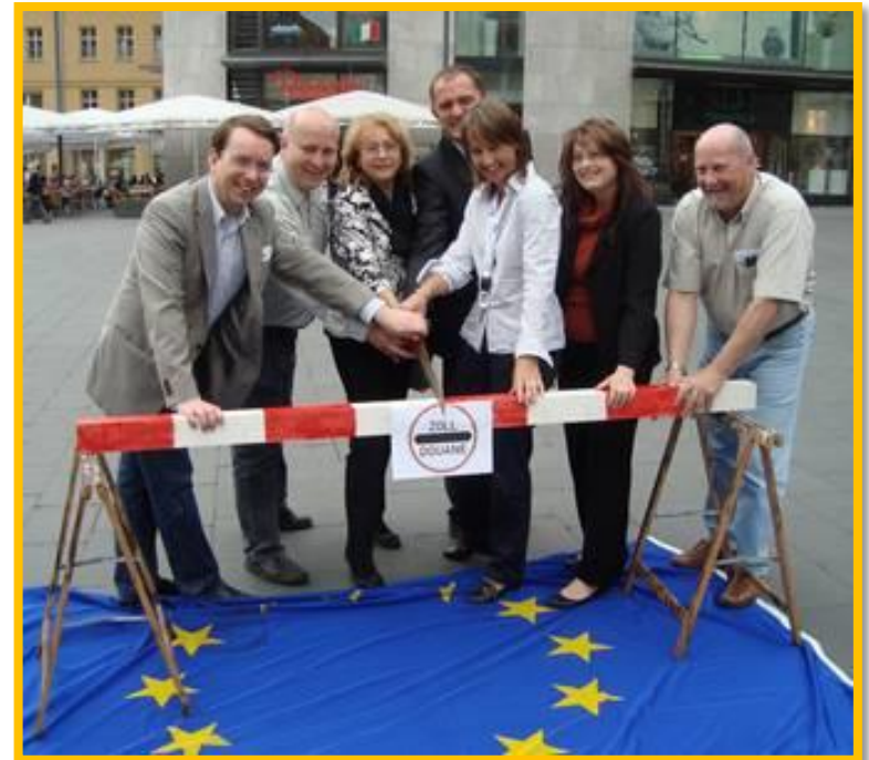
Protestaktion gegen die Einführung von Kontrollen an der Dänisch-Deutschen Grenze, Halle 2011